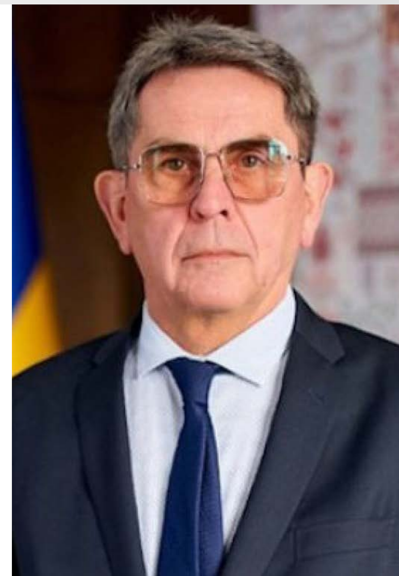
З ПОВАГОЮ, ПРЕЗИДЕНТ ФОРУМУ ПРОФЕСОР ІЛЛЯ ЄМЕЦЬ

Сподіваюсь, що цьогорічна зустріч в дистанційному форматі зможе об'єднати ще більше учасників з різних країн, а знання отримані під час Форуму стануть в нагоді в покращенні медичної допомоги пацієнтам з вродженими та набутими вадами серця.